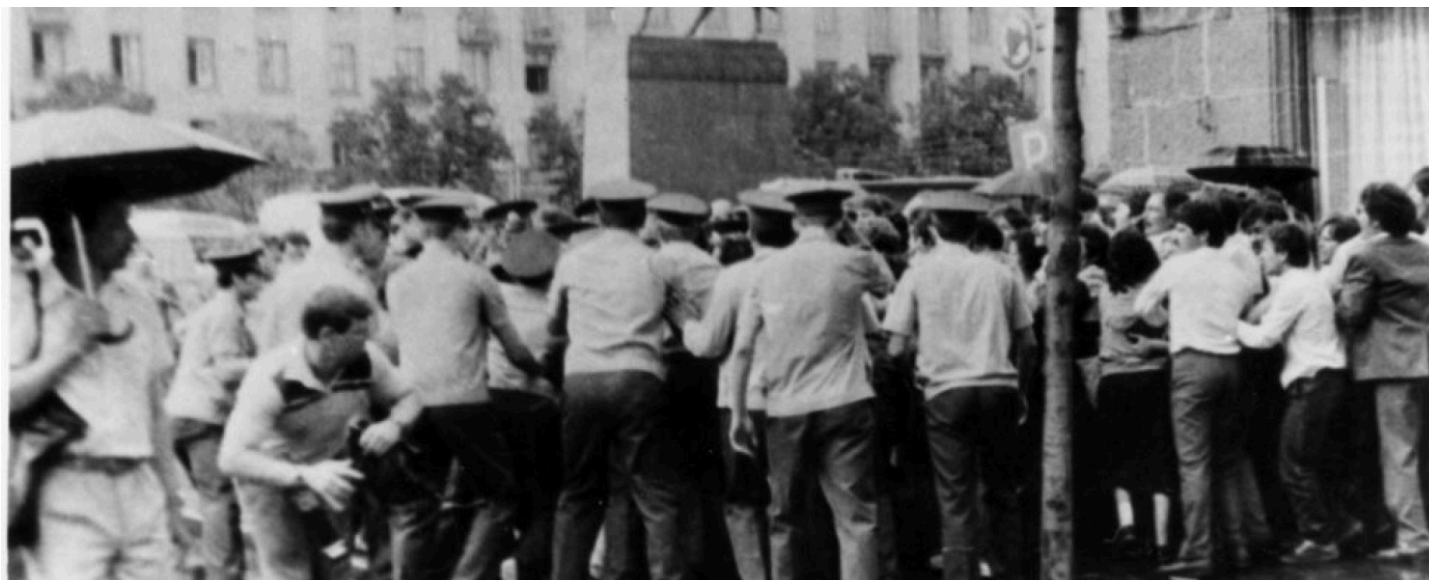
Демонстрация крымских татар у здания Моссовета в Москве 28 августа 1988 года.