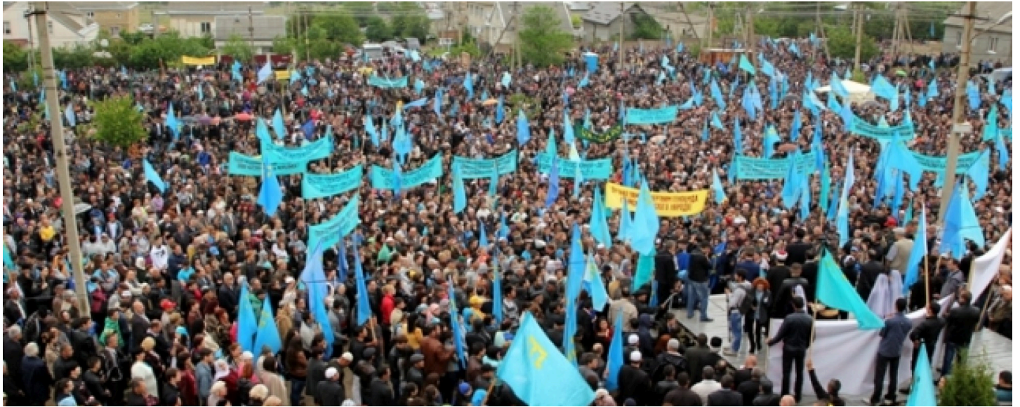
Митинг крымских татар в Симферополе 18 мая.