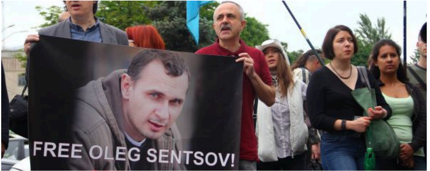
Пикет в поддержку Олега Сенцова у посольства РФ в Киеве.