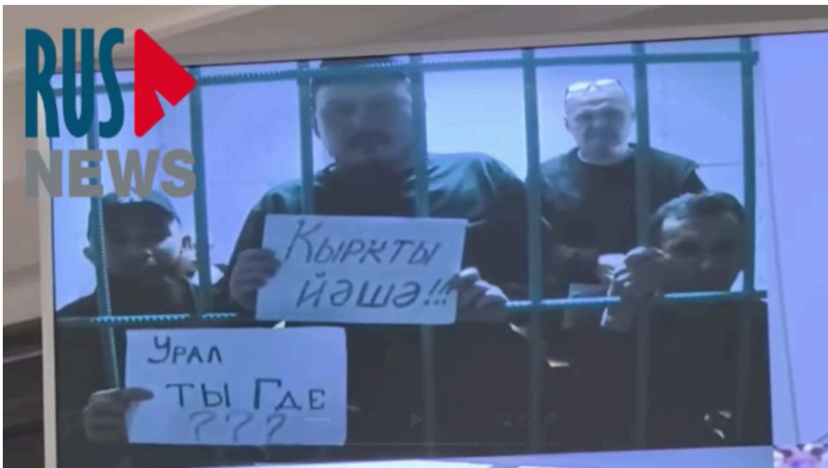
Снимок одного из заседаний Верховного суда России по «баймакскому делу» от 3 июня 2025 года.

Со стороны защиты выступили свидетели — уже осужденные по «баймакскому делу» мужчины. Адвокаты говорят с ними по видеосвязи, а они сами находятся в колониях.