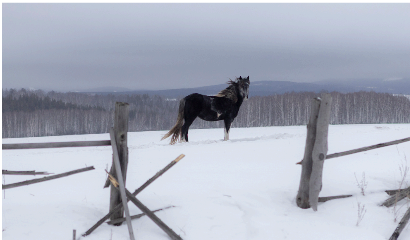
Чем ближе к Баймаку, тем больше табунов лошадей по обе стороны дороги