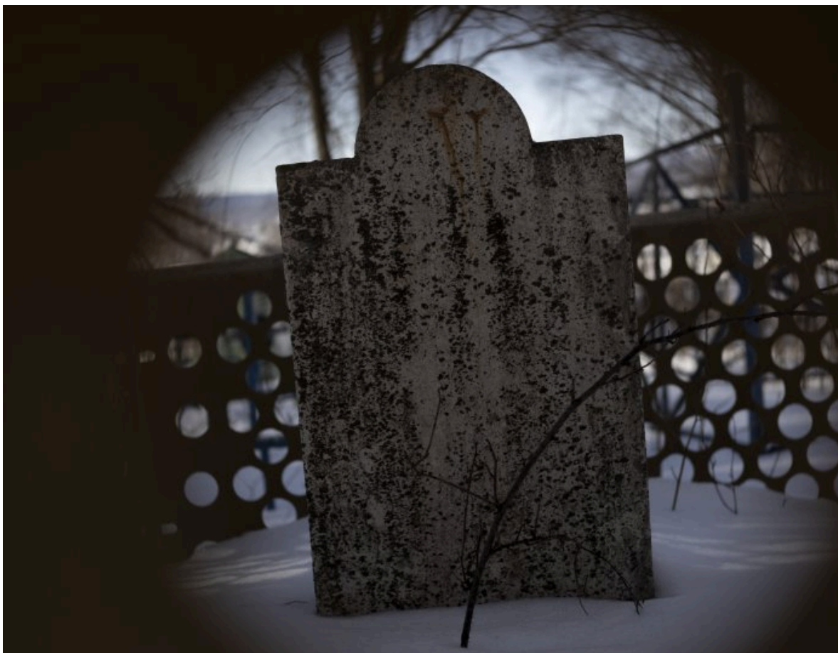
Кладбищенское надгробие в селе Мурсалимкино