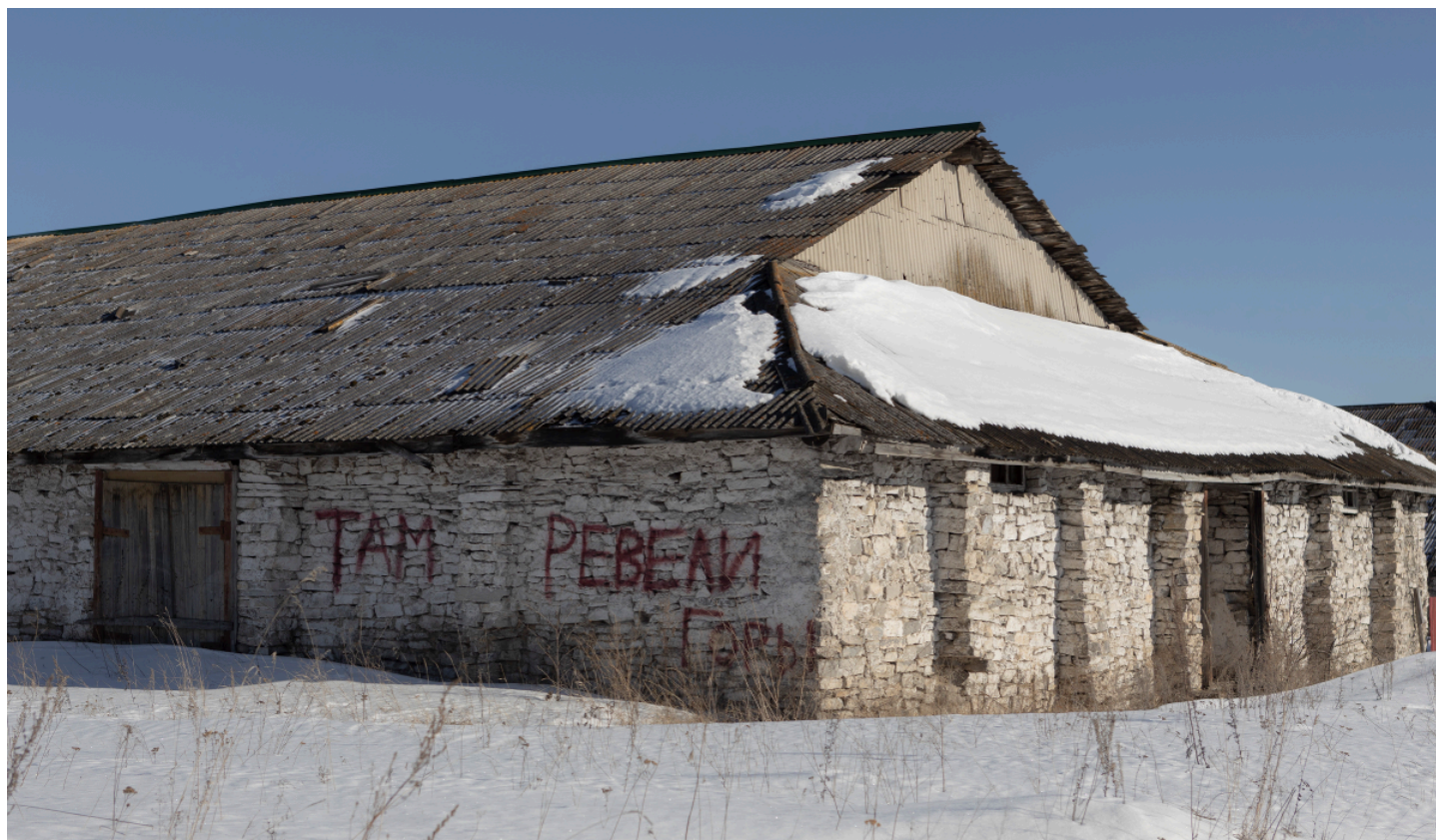
Село Мурсалимкино

делают, как им выгодно и удобно. Мы пока на себе лично не чувствуем — не лезем в политику. Страшно стало, потому что... тоталитарная страна стала, лишнего не скажешь: боишься. Данис как-то рассказал, что к ним привезли парнишку, которого взяли за то, что он оставил какой-то комментарий под видео».