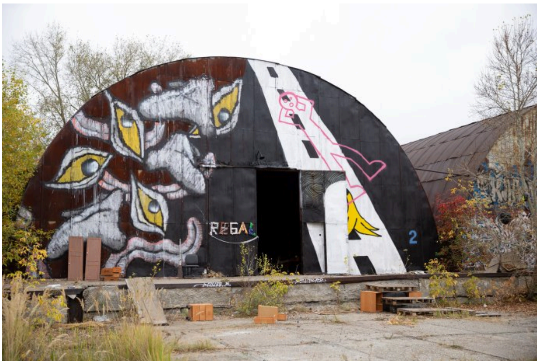
Ангар, в котором проходила выставка «Энтропия», 21 сентября 2024 года

«Место находится рядом с тем, где проходила предыдущая „Заброшка“, — продолжает он. — Художники не любят однообразие, люди хотели новое место. [В этот раз] у полиции был посыл, что тут опасный район, бывают наркоманы и драки, но две предыдущие „Заброшки“ прошли без проблем. Хотя первая была локальная и малюсенькая, ее и заметить сложно было, а вторая уже была здоровая и буквально в том же пространстве, просто через лесок».