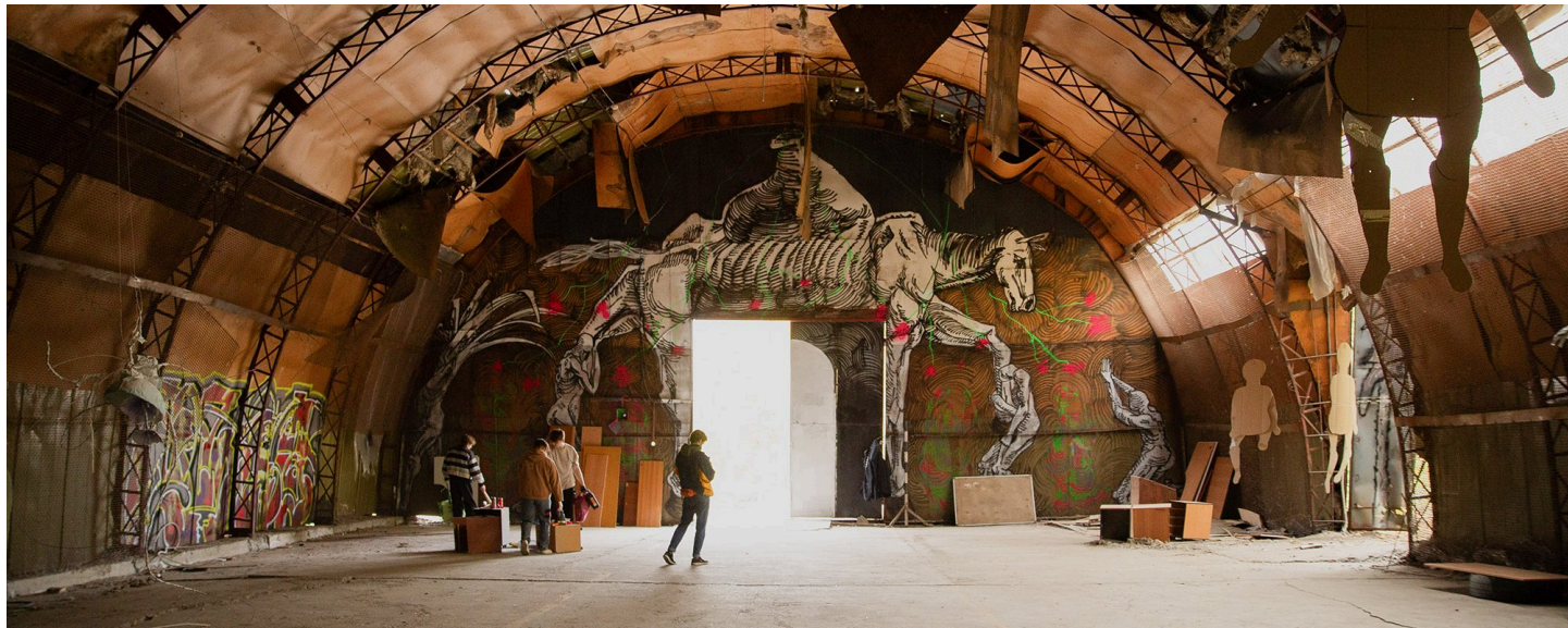
Выставка «Энтропия» сообщества ZABROSHKA в Екатеринбурге, 21 сентября 2024 года