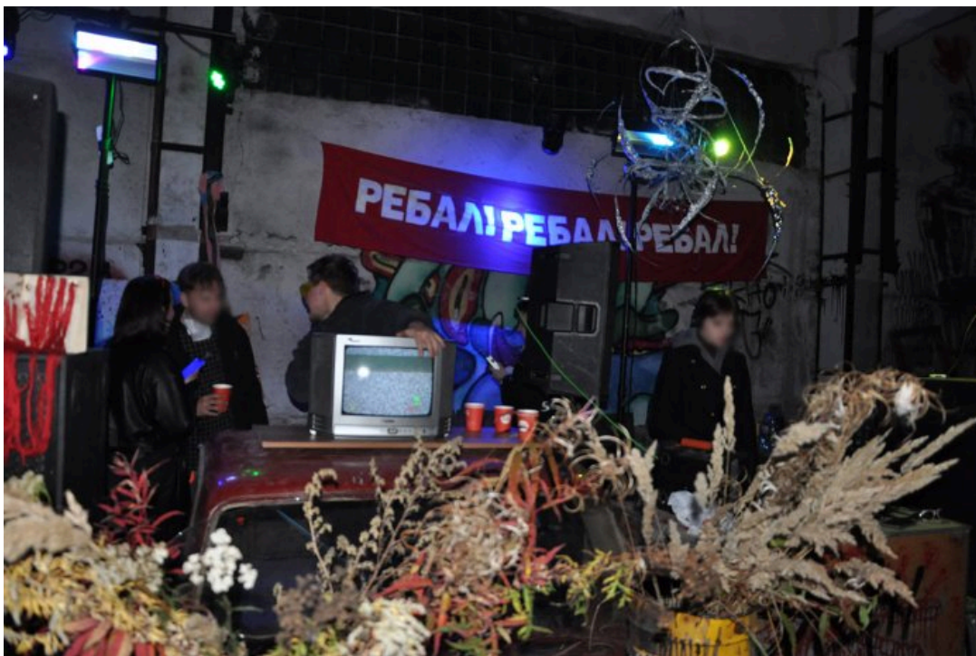
Вечеринка сообщества Ребал, 21 сентября 2024 года

Корреспондентка ОВД-Инфо обратилась за комментарием к сообществу Ребал, но участники команды отказались говорить, сославшись на анонимный концепт мероприятия. Позднее на связь с ОВД-Инфо вышел человек, назвавшийся пресс-секретарем Ребал, который согласился рассказать о том, что случилось на вечеринке тем вечером, не называя своего имени — «из соображений личной безопасности»: