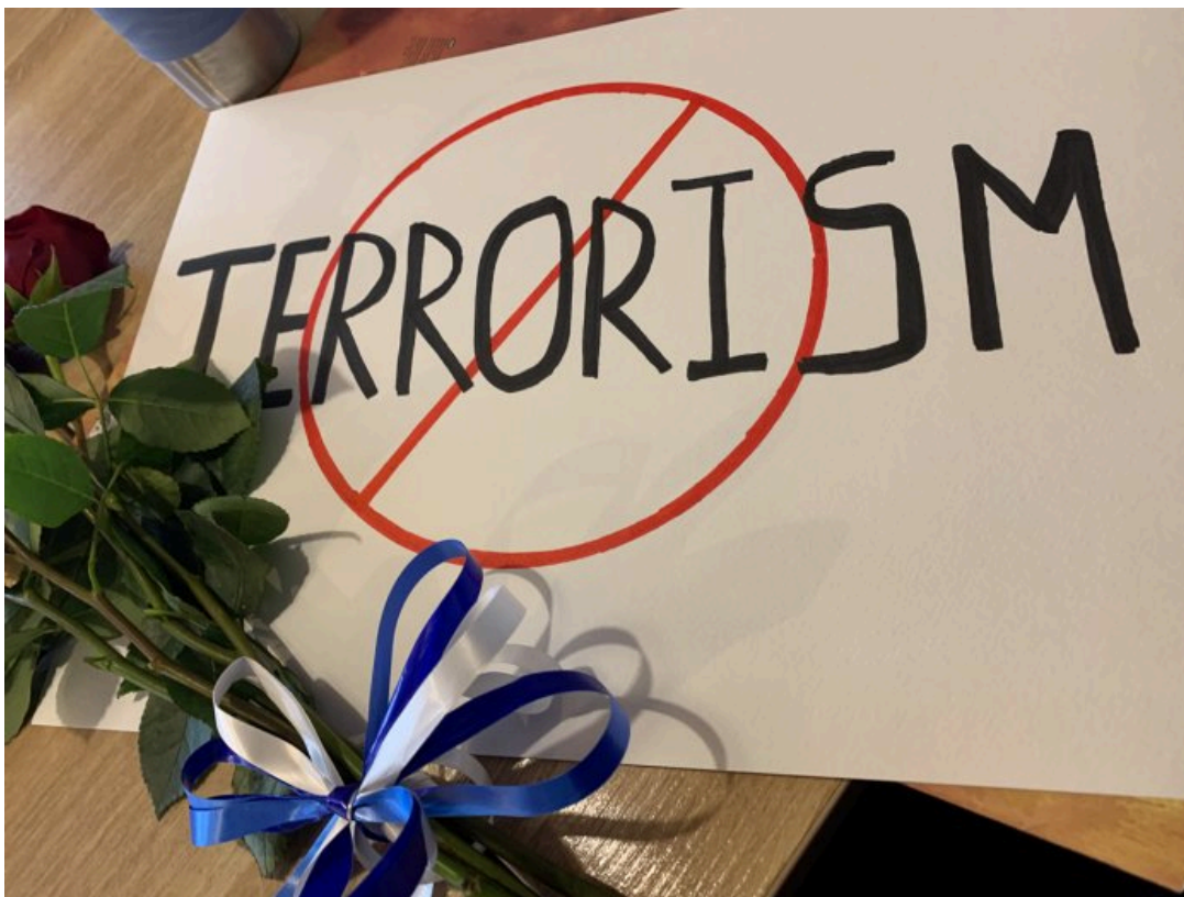
Плакат, с которым задержали Ирину

На данный момент по делу от меня требуется явка в отдел для «исправления неточностей в протоколе». Я со своей стороны не вижу в этом необходимости. Адвокат также не видит необходимости в моей явке. Но она готова сопровождать меня и консультировать, если потребуется, сейчас мы на связи.