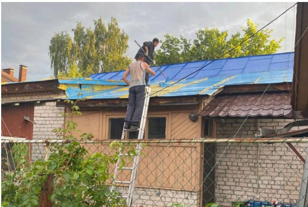
Неизвестные перекрашивают крышу дома Александра

После того, как я дал показания, выяснилось, что помимо обыска по статье о заведомо ложном сообщении о теракте (ч. 2 ст. 207 УК), на меня еще снова сфабриковали административку о дискредитации (ч. 1 ст. 20.3.3 КоАП). Протокол точь-в-точь как в прошлом году — полицейский буквально с листочка переписывал. Я его спросил, всегда ли он так делает, он ответил: «А какая разница?»