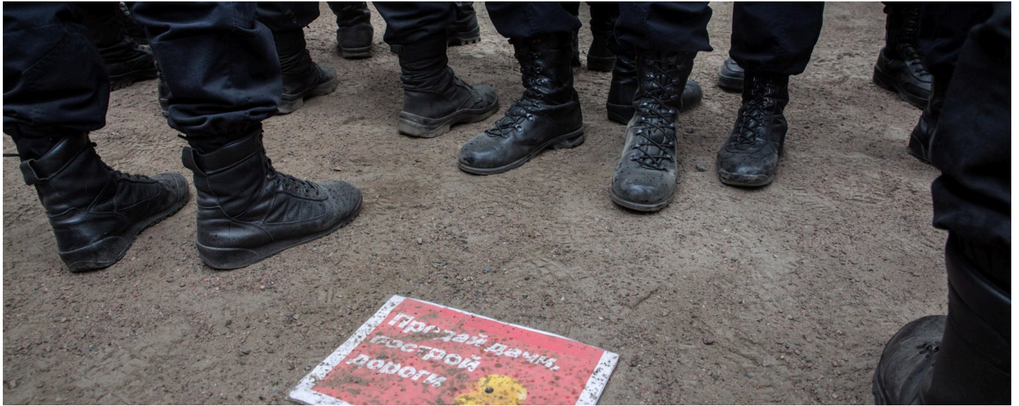
Фото: Митинг 12 июня в Петербурге/Давид Френкель