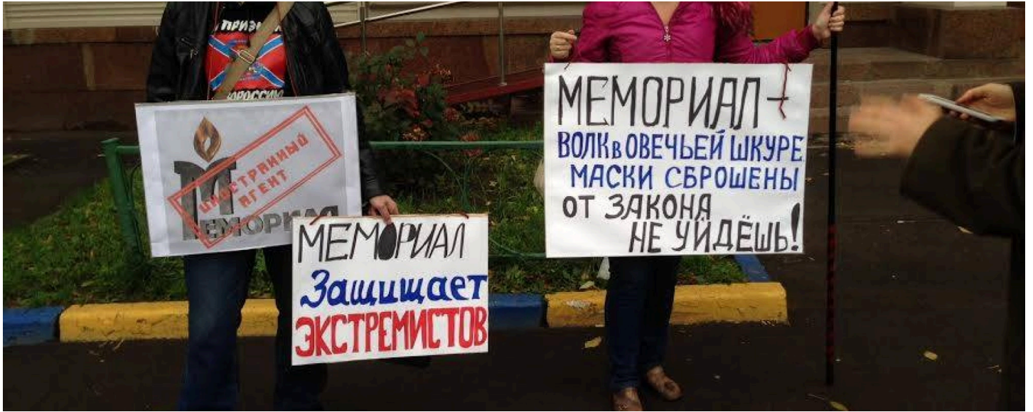
Пикет НОДа возле офиса "Международного Мемориала"