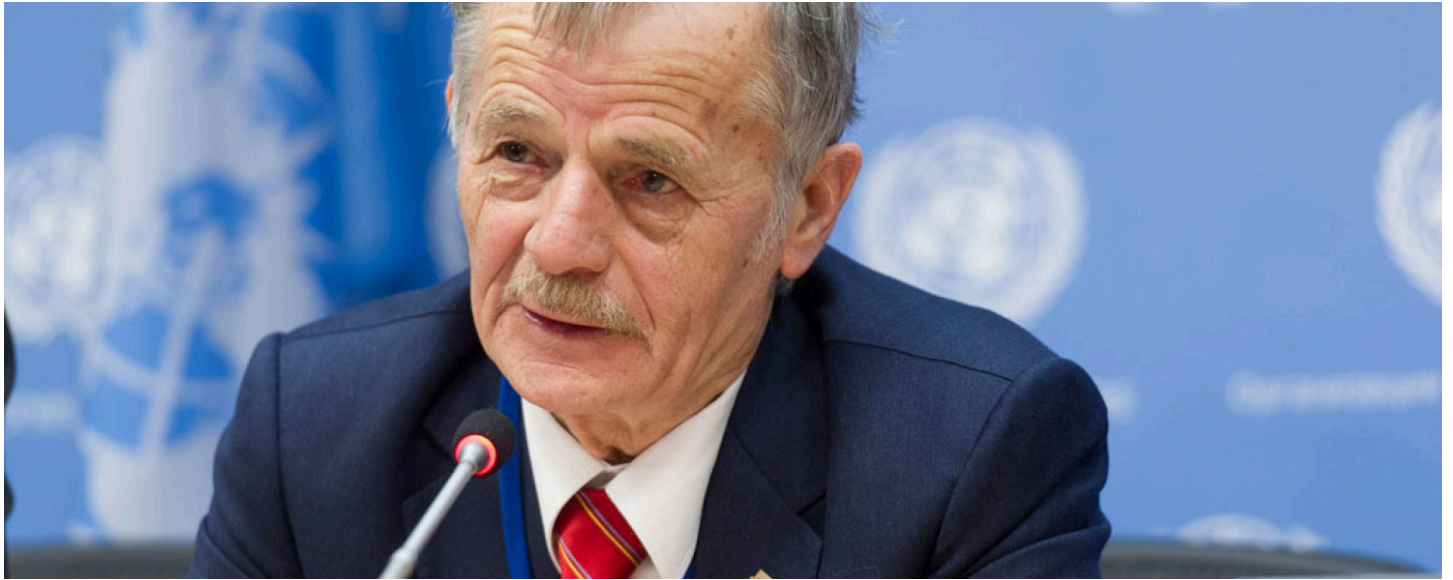
Мустафа Джемилев.