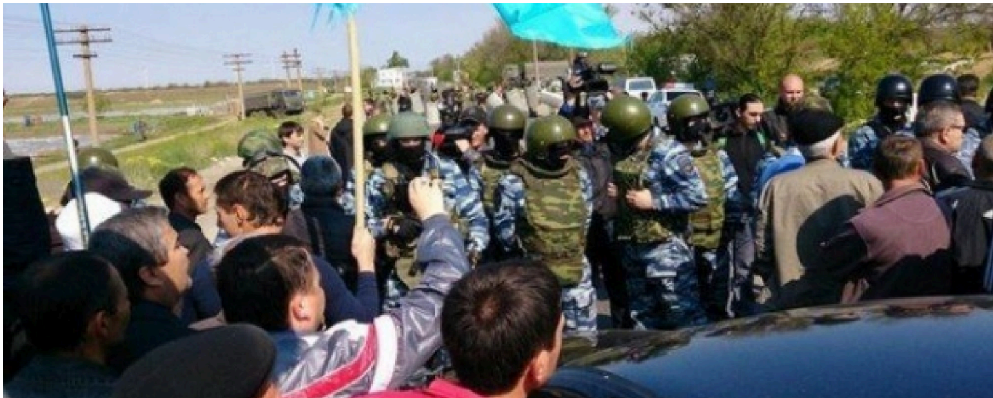
ОМОН и протестующие возле Армянска 3 мая 2014 года.